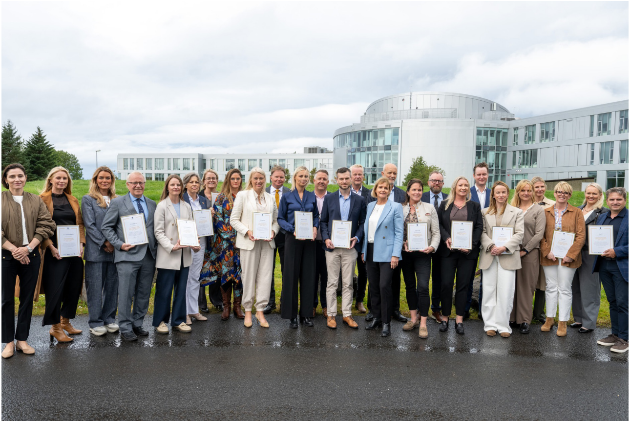
Fulltrúar þeirra 18 fyrirtækja sem hlutu viðurkenningu fyrir góða stjórnarhætti 2025.